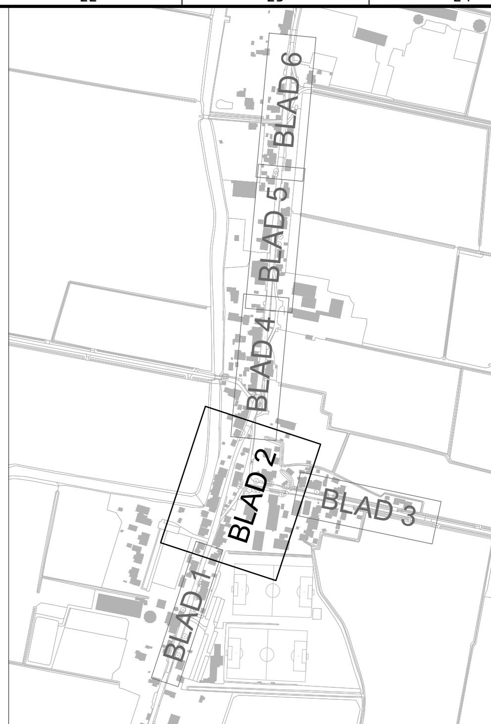
BLADINDELING SCHAAL 1 : 5000