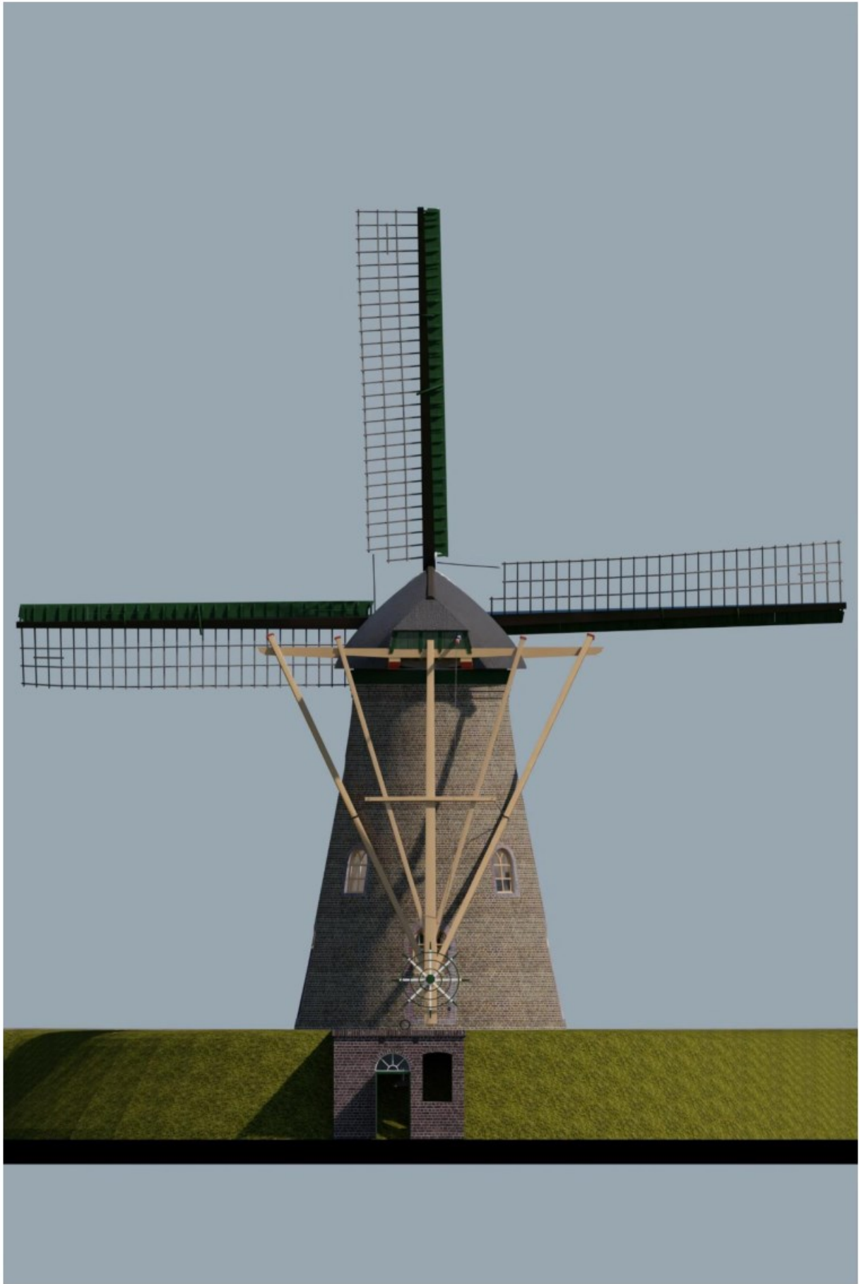
Afb.3: Achteraanzicht uit noordoostelijke richting. (Ontwerp: P. Dorst)