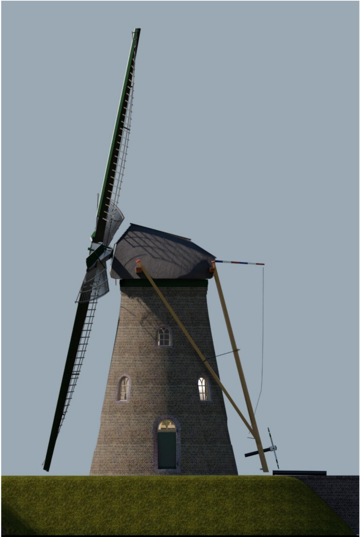
Afb.2: Zijaanzicht uit zuidoostelijke richting. (Ontwerp: P. Dorst)