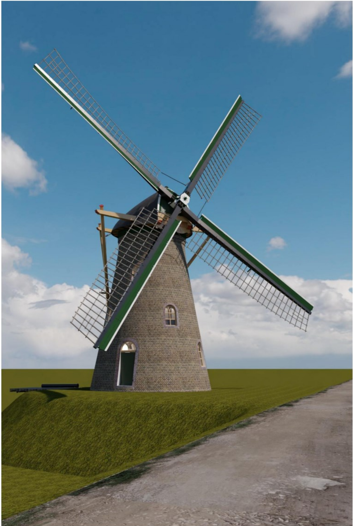
Afb 5: Overzicht uit westelijke richting. (Ontwerp: P. Dorst)