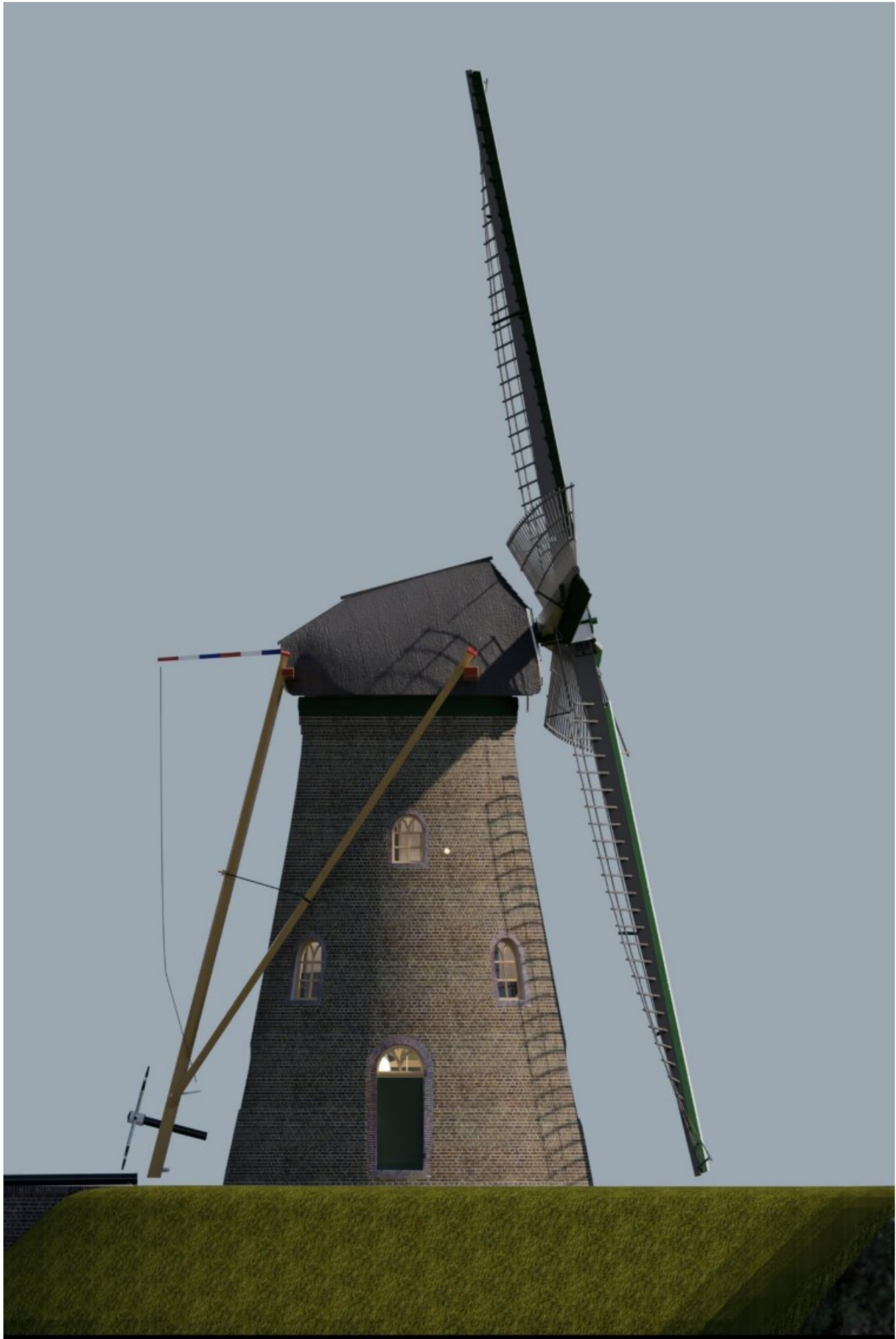
Afb.4: zijaanzicht uit noordwestelijke richting. (Ontwerp: P. Dorst)