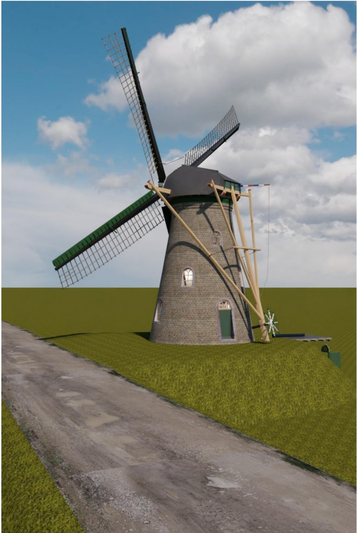
Afb.6: Overzicht uit zuidelijke richting. (Ontwerp: P. Dorst)