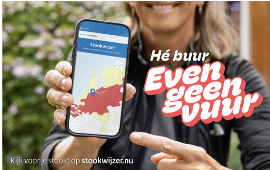
houtstook in uw omgeving.

Op www.gemeentehw.nl/houtstook vindt u meer informatie over de Stookwijzer, een aantal stooktips voor minder rook en geur én wat u kunt doen als u overlast ervaart van